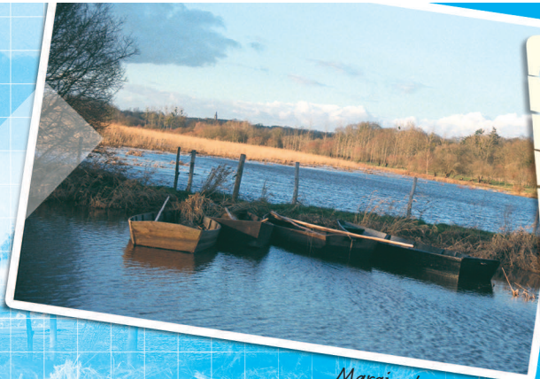
Marais de Gannelled