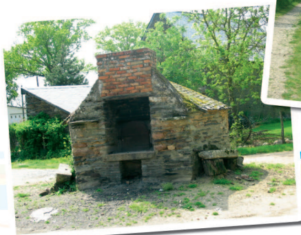
Four le Pré

Muni de jumelles, petite pause pour admirer au détour d'une fenêtre paysagère le marais de Gannedel.